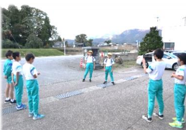
【 伝えるための動画撮影 】