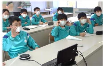
【 他校の友達との交流 】