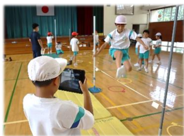
【 動きを撮影して確認 】