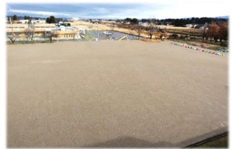
【きれいに改修されたグラウンド】

9月下旬からグラウンド改修工事が進められていましたが、先日無事に検査を終了しました。工事に携わってくださった皆さんには、残暑厳しい中、また、雨風冷たい天候の中、毎日グラウンドをきれいにするためにご尽力いただきました。改修工事に関わってくださった関係者の皆さま、ありがとうございました。もうしばらく、土を落ち着かせる期間を経て、使用いたします。その日を、子供たちと共に楽しみにしています。