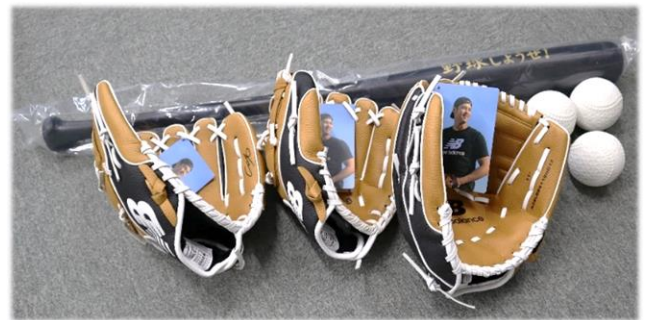
【寄贈された野球用具一式】

1月16日(火)に、ロサンゼルス・ドジャースの大谷翔平選手からのプレゼントが届きました。待望の「大谷グローブ」です。右利き用2個、左利き用1個の計3個です。早速子供たちに披露しました。子供たちも教職員も、まじまじと眺めたり、手にはめて感触を確かめたりしました。