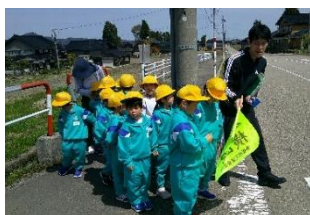
〈1・2年交通安全教室〉

地域の方々には、4月や5月に交通安全街頭指導に出いただき、感謝しております。学校では、南砺警察署や東太美、西太美駐在所にご協力いただき、1・2年生の交通安全教室、3年生の自転車教室を行いました。交差点での歩き方や自転車での渡り方を教えていただきました。子供たちは正しく安全な渡り方を改めて学ぶことができました。自転車教室では、育成会学級委員の皆様にご協力いただきました。ありがとうございました。