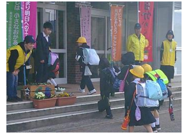
〈朝のみまもりあいさつ運動〉

今年度も、「相手の目を見て、自分から挨拶ができる」南部っ子の姿を楽しみに、挨拶運動の方法を工夫しながら呼びかけを続けていきます。 (運営委員会担当)