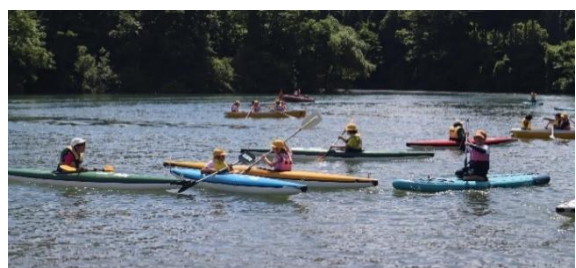
【水上スポーツ体験】

子供たちの振り返りでは、「挑戦は100点です。最初はカヌーが揺れると怖かったけれど、慣れてくると自由に動くコツが分かり、楽しくなってきました。頑張って挑戦してよかったです」と、挑戦し続けて頑張れたから楽しめたのだと、行動を価値付けしていました。また、「一人では山道は行けないけれど、みんな協力してクイズを解いたり、滑りやすい道も励まし合ったりしたから、最後は楽しかったと思えた。協力は大切だと思った」と振り返っている子供もいました。