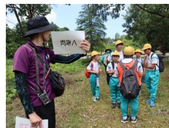
【追跡ハイクに挑戦】

いつもとは違う環境で「挑戦して乗り越えること」「協力してやり遂げること」を体感し、大きく成長してきました。これから様々な場面で立ち足かかる壁に出会っても、乗り越える自信につながっていくことを願っています。